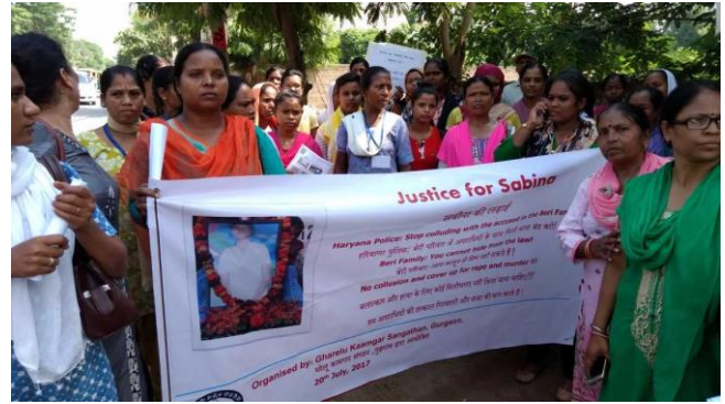
Asia / India: El sindicato de trabajadores del hogar busca justicia para una trabajadora del hogar menor de edad que fue violada y asesinada. Después de más de un año, la lucha sigue en marcha.