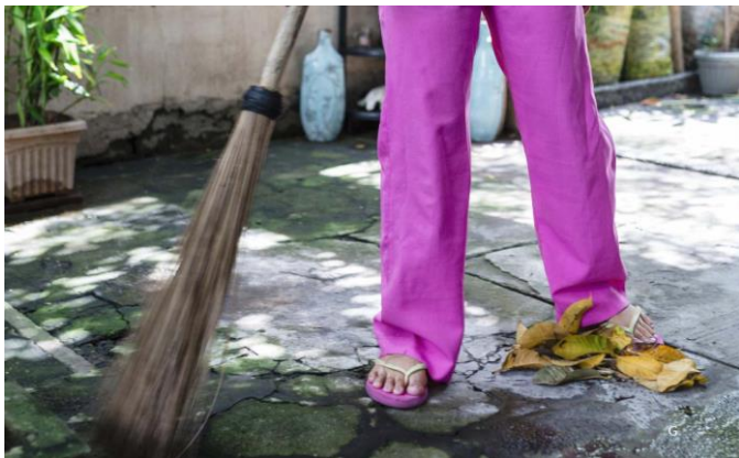
Asia: Las directrices internacionales son un camino para impulsar condiciones de vida y de trabajo decentes para los migrantes - Informe sobre la Consulta Regional de Asia sobre el Pacto de las Naciones Unidas sobre la Migración (En inglés).